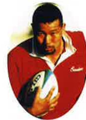
現役時代の大八木さん

同志社大学では大学選手権3連覇、神戸製鋼では7年連続日本一に輝いた、名実ともに日本を代表するラグーマン。2007年よりラグビー不毛の地・高知に乗り込み高知中央高校のGMを務め全国大会出場への道を拓く。初出場は完敗だったものの“平成版スクールウォーズ”と言われる熱のこもった指導が話題。